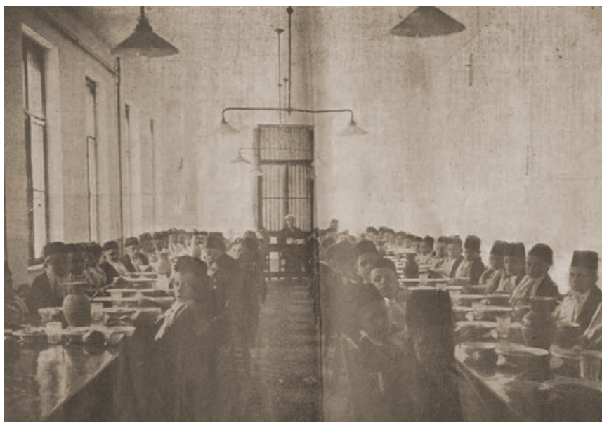
Sl. 6. Pitomci u blagovaonici (Muslimansko sirotište za Bosnu i Hercegovinu, 1913)