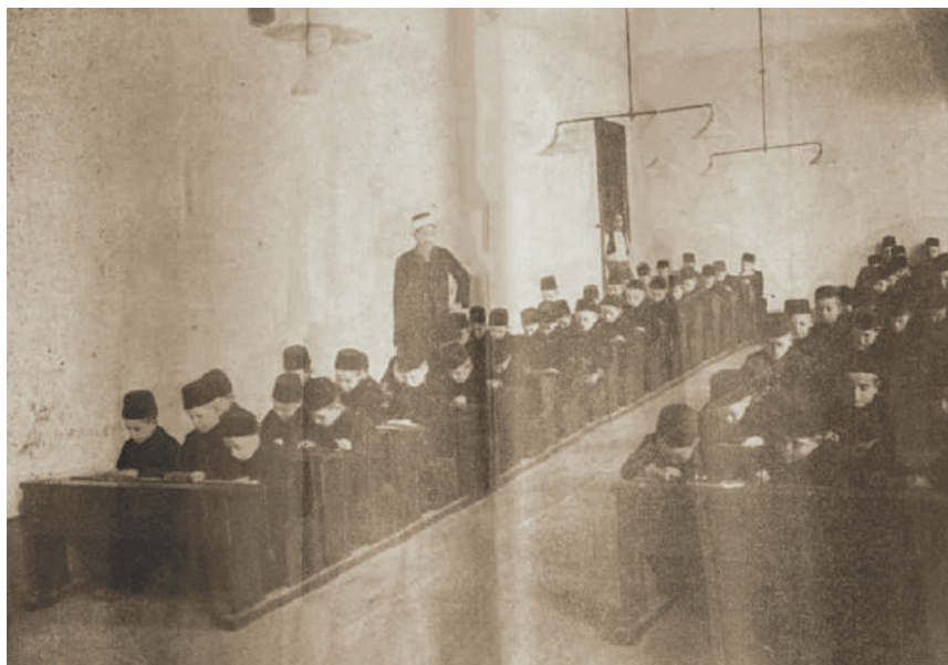
Sl. 5. Mualim i pitomci za vrijeme nastave (Muslimansko sirotište za Bosnu i Hercegovinu, 1913)