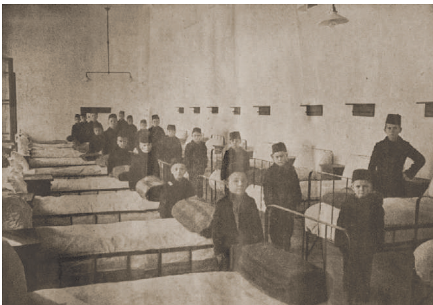
Sl. 4. Pitomci u jednoj od spavaonica (Muslimansko sirotište za Bosnu i Hercegovinu, 1913)