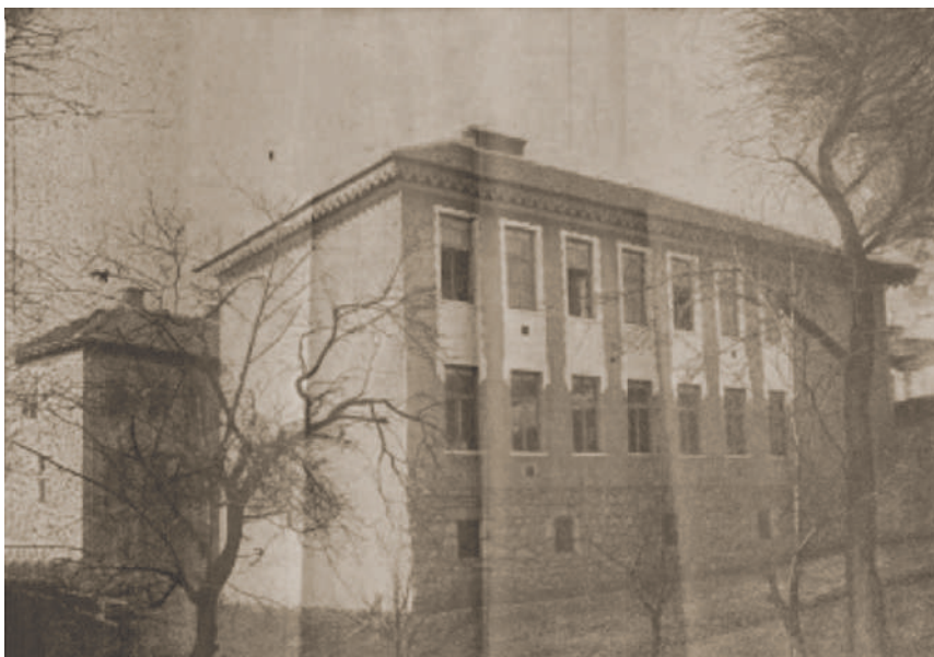
Sl. 3. Zgrada sirotišta (Muslimansko sirotište za Bosnu i Hercegovinu, 1913)