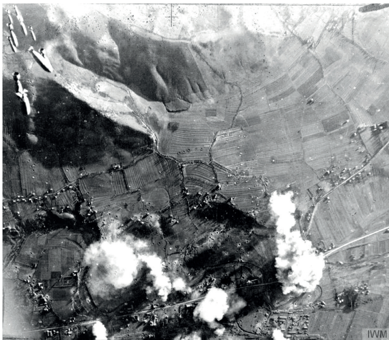
Aerofoto snimak britanskog bombardovanja Alipašino Mosta.

Za napade od 7. novembra navedeni su različiti brojevi poginulih i ranjenih. U izvještaju MINORS-a od 11. novembra 1944. godine dat je broj od 253 poginula, 130 ranjenih koji su tražili ljekarsku pomoć i 180 srušenih kuća. 76 Izvještaj Kotarskog nadzorništva narodne zaštite od 13. novembra navodi 300 poginulih i 220 ranjenih. Samo u podrumu zgrade Bratinske