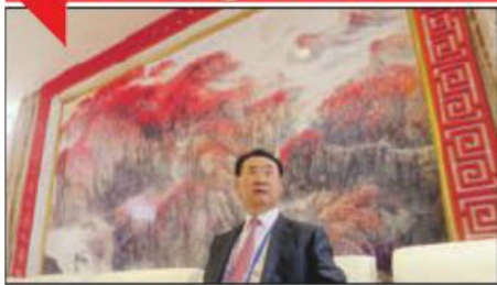
Dianlin: Finansira gradnju