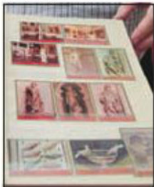
Dio zbirke poštanskih marki