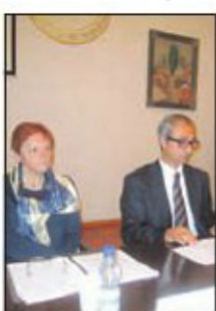
S jučerašnje konferencije: Bit će predstavljeno 116 referata