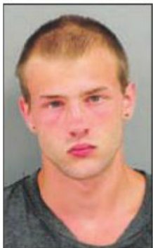
Raper: Uhapšen slučajno