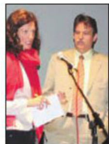
OKC "Abrašević": Mesa pozdravio gledaoce

Ovom konferencijom napravit ćemo jednu tribinu na kojoj će dijalog voditi naučnici iz BiH, Evrope i svijeta o svim aspektima Prvog svjetskog rata. Želimo govoriti o pretpostavkama Prvog svjetskog rata, ideološkim, diplomatskim ute-